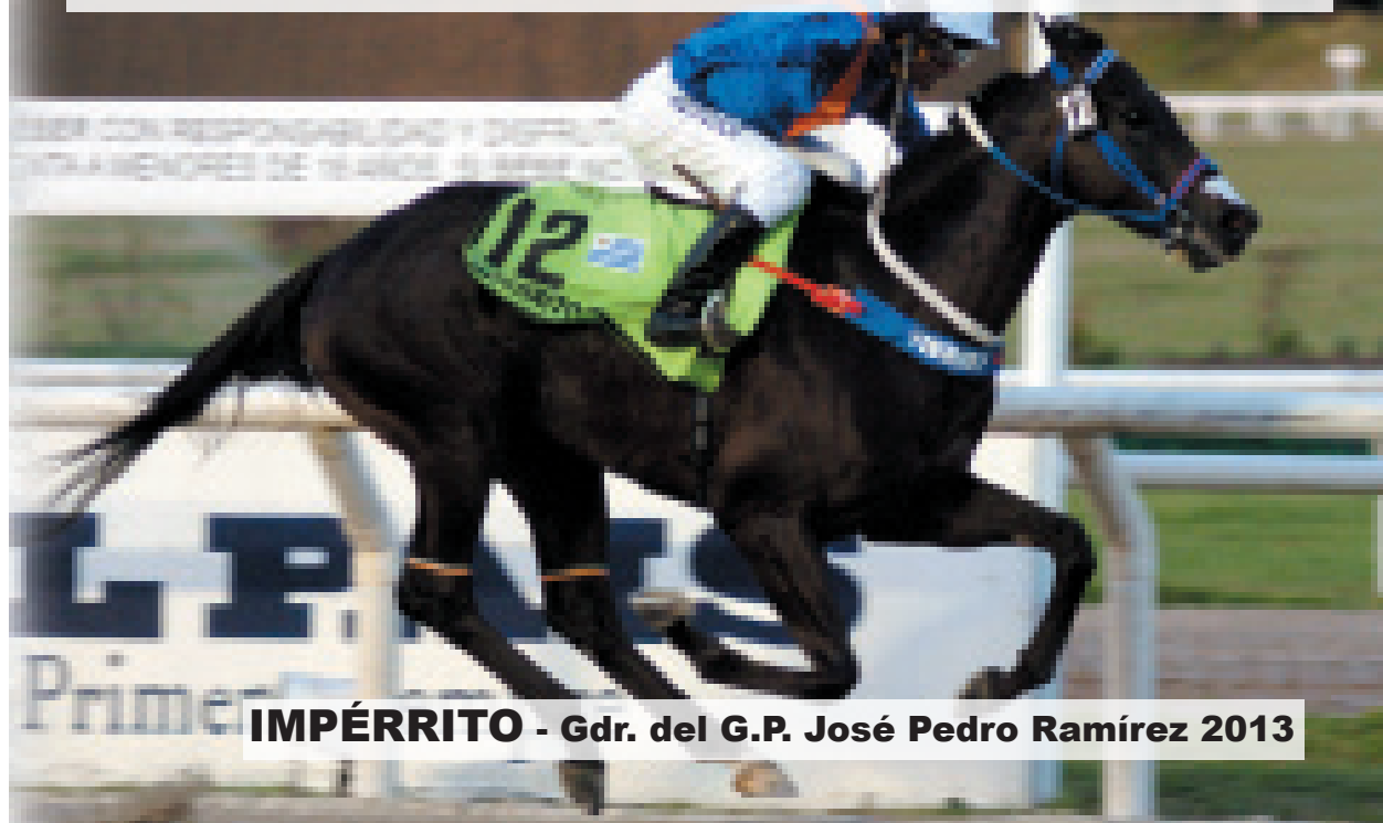
IMPÉRRITO - Gdr. del G.P. José Pedro Ramírez 2013