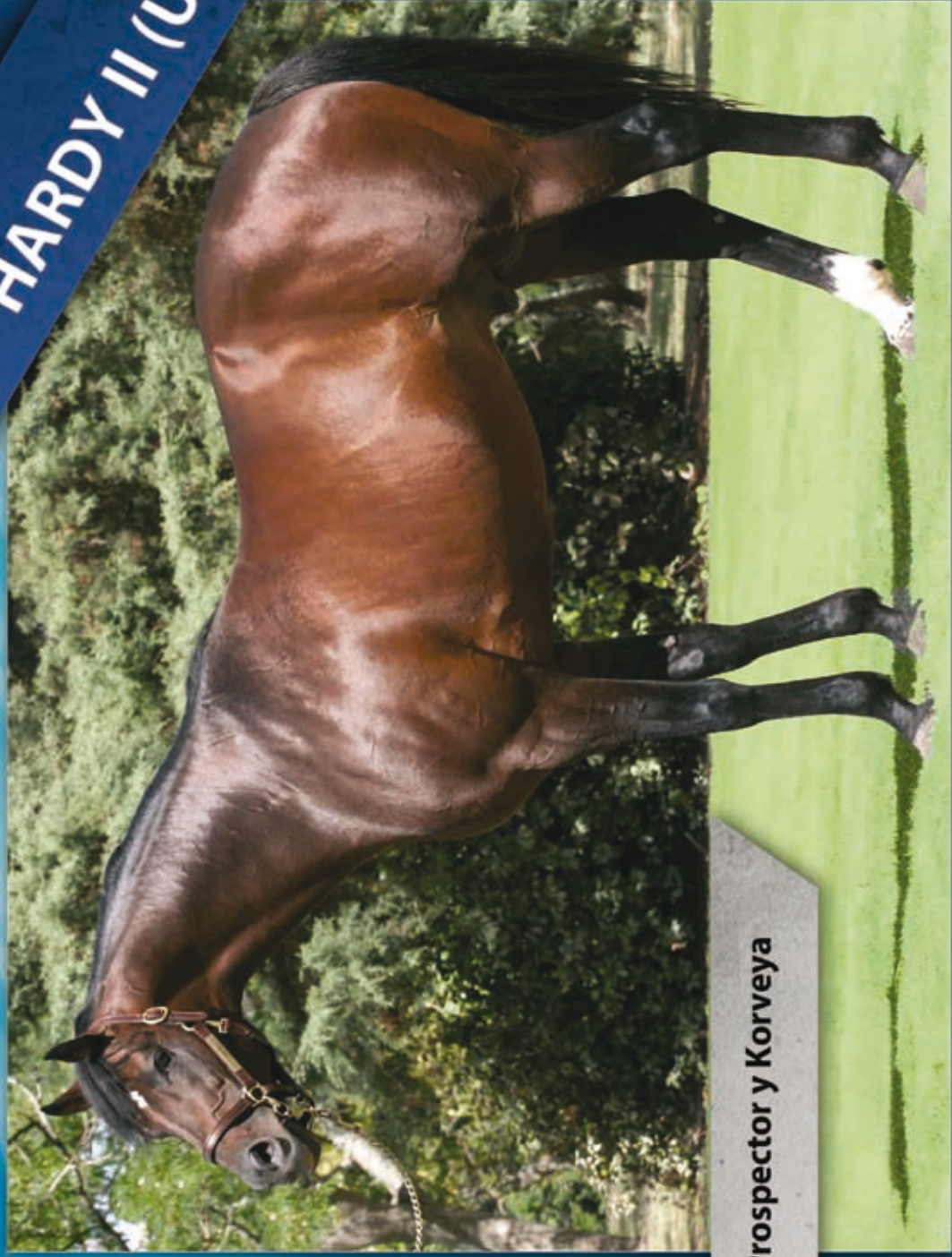
Mr. Prospector y Korveya